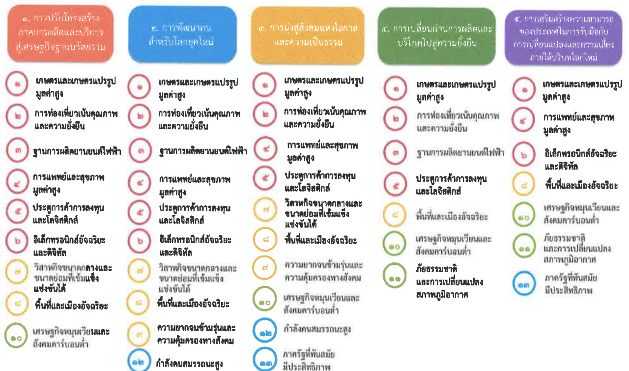
แผนภาพที่ ๓.๑ ความเชื่อมโยงระหว่างหมวดหมู่การพัฒนากับเป้าหมายหลัก

ความเชื่อมโยงระหว่างหมวดหมู่การพัฒนากับเป้าหมายหลักแสดงไว้ในแผนภาพที่ ๓.๑ โดยหมวดหมู่การพัฒนาที่กำหนดขึ้นเป็นประเด็นที่มีลักษณะเชิงบูรณาการที่ครอบคลุมการพัฒนาตั้งแต่ในระดับต้นน้ำจนถึงปลายน้ำ และสามารถนำไปสู่ผลพัฒนาทั้งในมิติเศรษฐกิจ สังคม ทรัพยากรธรรมชาติและสิ่งแวดล้อมไปพร้อมๆ กัน ทำให้หมวดหมู่แต่ละประการสามารถสนับสนุนเป้าหมายหลักได้มากกว่าหนึ่งข้อ นอกจากนี้การพัฒนาภายใต้แต่ละหมวดหมู่ไม่ได้แยกขาดจากกัน แต่มีการสนับสนุนหรือเอื้อประโยชน์ซึ่งกันและกัน